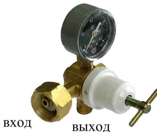
Рис.2 Редуктор СПО-6 ДЖЕТ 278 00 00 00

1—манометр рабочего давления; 2—штуцер входной; 3—штуцер выходной; 4 - регулировочный винт